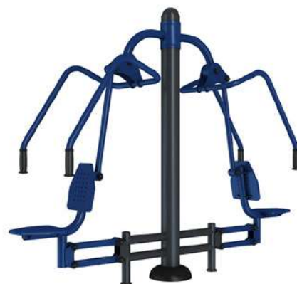
DOBLE DORSAL B016

Elemento biosaludable para hacer deporte en la calle, apto para personas grandes y deportistas. Fortalece los músculos de las extremidades superiores, el hombro y la espalda, y mejora la flexibilidad, la agilidad y la coordinación de las articulaciones del codo. Favorece la flexión y el estiramiento de las articulaciones del hombro y del codo y ayuda a aliviar las molestias producidas por atrofia muscular, capsulitis retráctil, codo de tenista...etc