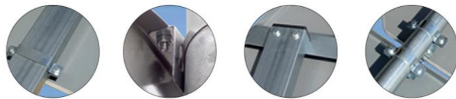
Different types of clamps

available in galvanized steel or in aluminium.